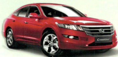
Транспортные средства (FM приемники)