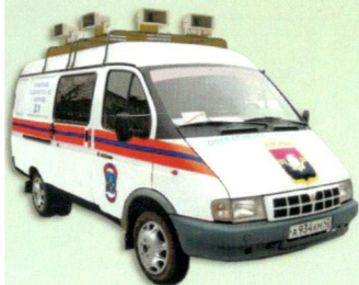
Машины с СГУ